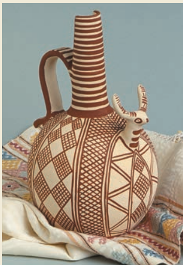
Tongefäß mit Verzierung