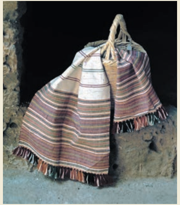
Baumwolltuch aus Lefkoniko