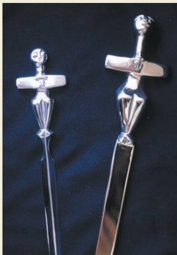
Brieföffner mit Idol