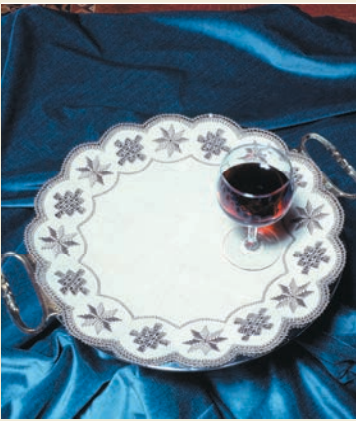
Lefkara - Stickerei