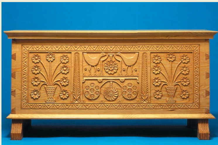
Truhe aus Fichtenholz mit geschnitzten Ornamenten